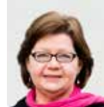
Kia Mundebo Konferensvärd FUB